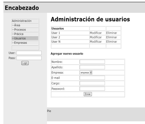
Figura 1. Pantalla de Administración de usuarios

A continuación se muestran algunas de las pantallas de la herramienta referidas a la administración de la misma. Ver Fig. 1, 2, 3 y 4.