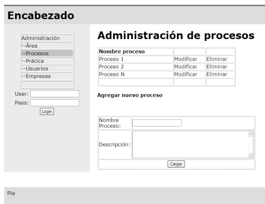
Figura 3. Pantalla de Administración de procesos